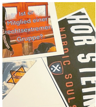
Modemarken, die von der rechten Szene getragen werden: Mit Postkarten wollen die Schüler für das Thema sensibilisieren.

Auf Anti-Corona-Demonstrationen wurde der Judenstern von rechts missbraucht. Er wurde mit der Aufschrift „Ungeimpft“ versehen und von Demonstrierenden auf die Kleidung geheftet. Dieser Missbrauch demütigt in massiver Weise die Opfer des Holocausts, die den Stern tragen mussten. Im Jahr 2023 darf den Nazis keine Chance gegeben werden. Das heißt: Flagge zeigen gegen Rechts.